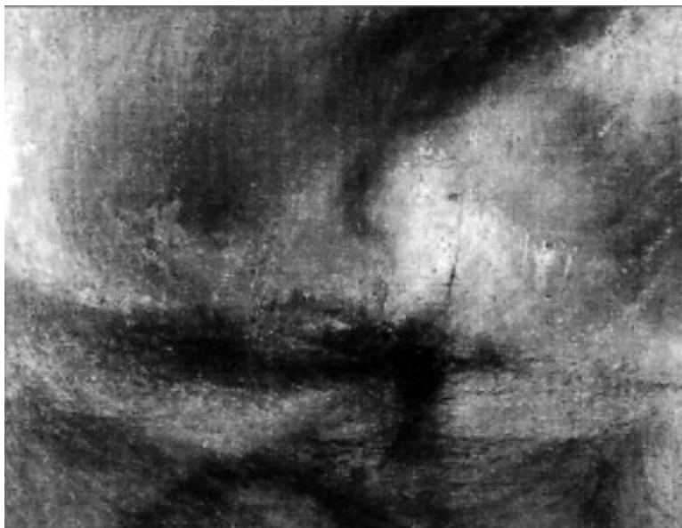
Уильям Тернер. Снежная буря - Пароход

Такими он их придумал. И виды Лондона, и "Пароход в снежную бурю" (1842), и "Покой: Похороны в море" (1842), и "Музыка в салоне" это, по преимуществу, тернеровские видения, если не фантазмы. Они по-своему красивы, как красивы "обстановочные" оперы или балеты XIX века, или, чтобы быть более точным, "чистая" музыка Брамса. Но ведь нельзя без конца ни сидеть в балете, ни услаждать себя Брамсом, как трудно быть долго с Тернером: захочется чего-то земного, "питательного" (А. Блок), скажем, Констебла,